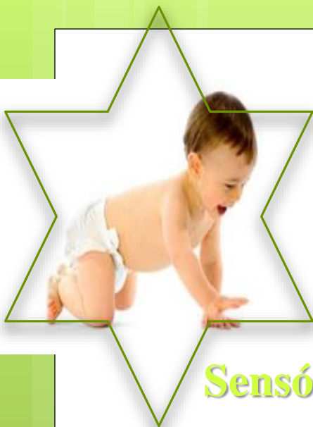
Sensório-Motor 0-2 anos