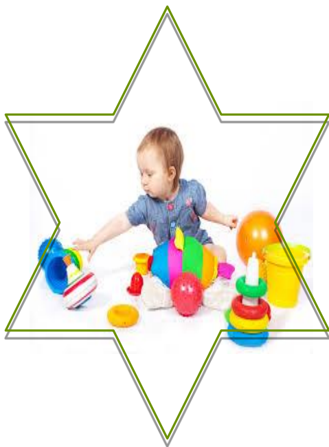
Pré-operatório 2-7 anos