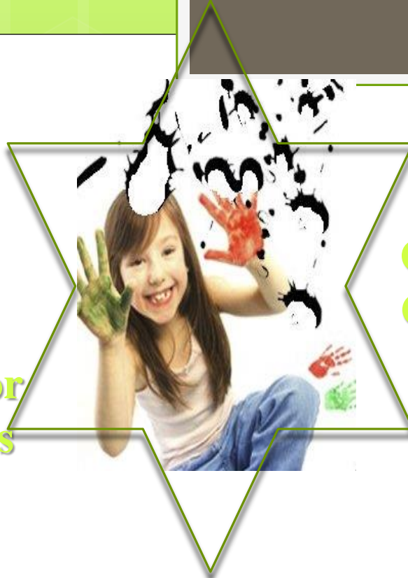
Operatório Concreto 7-11 anos